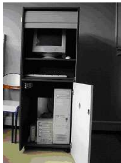
illustration 2: notre serveur local

Dans la classification en catégories de laboratoires multimédias, notre salle est à ranger parmi les « laboratoires hard », c'est-à-dire qu'on a affaire à un réseau local classique en parallèle duquel on a installé un réseau dit « propriétaire » prévu pour le transfert de signaux audio et vidéo analogiques ; ce double câblage permet une interactivité très poussée entre les postes sans avoir pour cela à installer de logiciels supplémentaires, notamment une interphonie sous différentes formes (avec par exemple écoute discrète d'un poste élève par le poste professeur), de multiples types de transferts de signaux écrans et claviers du poste professeur vers les postes élèves. Les « laboratoires hard » s'opposent aux « laboratoires softs », qui sont des salles en réseaux traditionnelles sur lesquelles on a installé des logiciels pédagogiques spécifiques. En plus de ses caractéristiques propres, un laboratoire « hard », comme tous les laboratoires multimédias, permet l'accès à des ressources dites « locales » (ainsi nommées parce qu'elles sont stockées sur le serveur local). Ces ressources peuvent être des fichiers de texte, d'image, de son, des documents multimédias, qui peuvent être situés sur n'importe quel lecteur du serveur (pourvu bien sûr qu'il s'agisse de fichiers mis en partage avec d'autres utilisateurs), y compris ses lecteurs externes (par exemple, un lecteur de CD-Rom ).