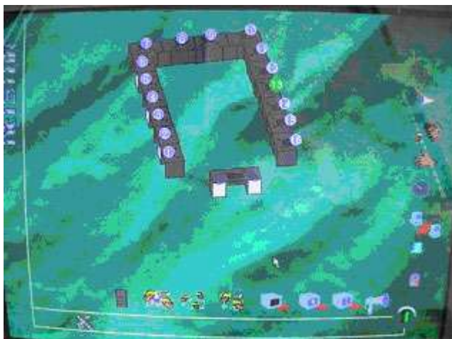
Le fond d'écran de Netstar

A droite de l'écran, des icônes composent un menu des interventions possibles du poste professeur sur les postes élèves : il s'agit des commandes suivantes :