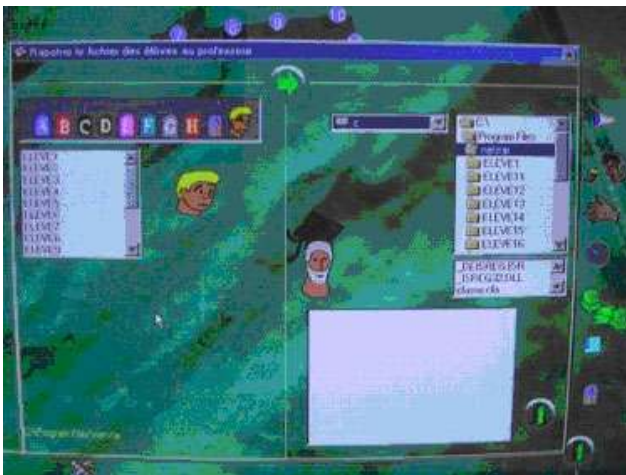
Illustration 5 : les deux fenêtres inférieures permettent de localiser précisément le fichier élève à télécharger.