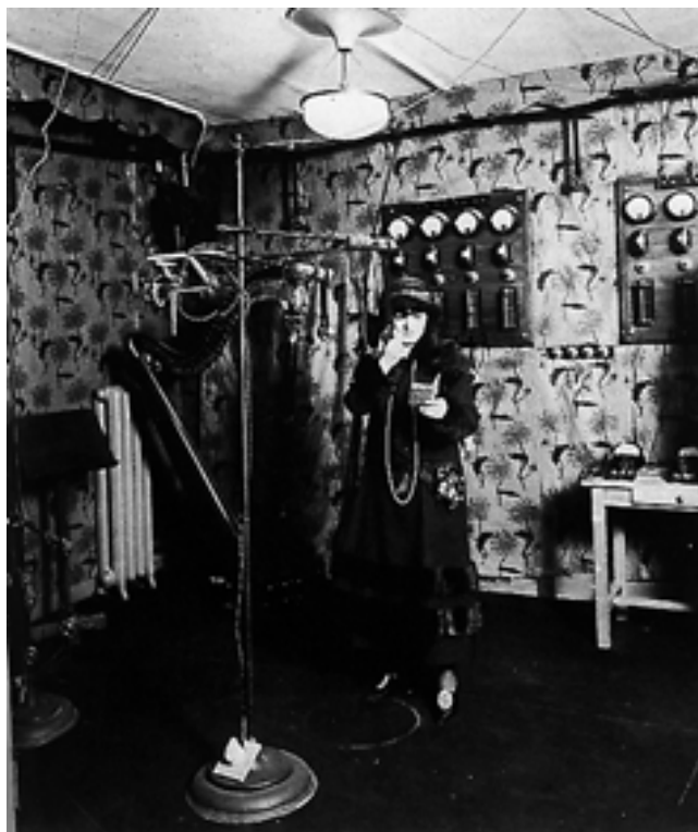
novembre 1922 : Anna de Noailles au micro du premier poste privé français : RADIOLA

Si la technique évolue vite grâce aux inventeurs et bricoleurs divers qui se nomment entre eux "les sans filistes", les programmes ne font pas preuve d'une grande diversité et sont plutôt austères. Qu'elles soient privées ou d'Etat, les radios diffusent des conférences ennuyeuses, entrecoupées de concerts de musique classique, souvent diffusés en direct du studio appelé encore auditorium. Néanmoins, les premiers hommes de radio, généralement anciens comédiens ou artistes, inventent ce métier nouveau et sont à l'origine des premiers journaux parlés, des premiers reportages sportifs en direct, des premiers jeux, débats ou feuilletons radiophoniques et des premières publicités radiodiffusées. Bref, tout ce qui fait la radio du XXI ème siècle a été inventé par ces pionniers.