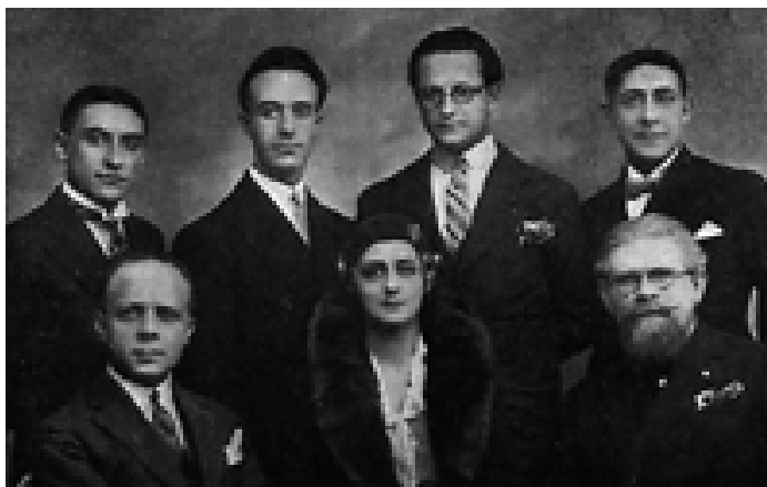
Les speakers de Radio Paris en 1930

Mais la radio privée est menacée au gré des ministres des PTT qui se succèdent. Aucune création privée nouvelle n'est autorisée, la publicité d'abord interdite est ensuite très réglementée, l'information est contrôlée. Les radios privées s'organisent et se regroupent en une "Fédération Française des Postes Privés".