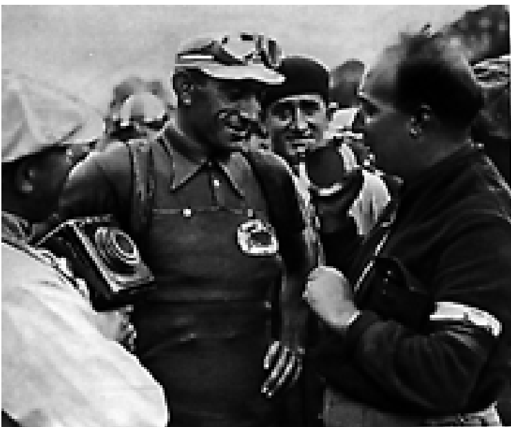
Reportage sportif de Georges Briquet au Poste Parisien (1936)

Les années 30 voient également naître des programmes plus populaires, plus distrayants, la musique légère remplace peu à peu la musique classique, les jeux radiophoniques connaissent un succès grandissant, les grands feuilletons (notamment la Famille Duraton) passionnent la France.